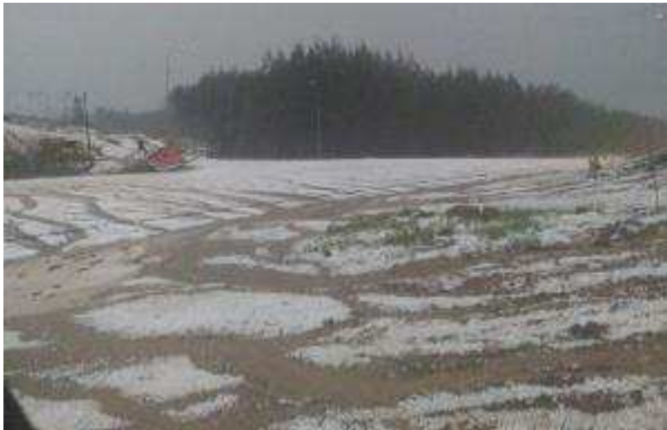
Foto 1: granizo em Timbó Grande no dia 19/09/2021.